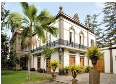
Jardín de la Marquesa

Tendrá de plazo del 20 de junio al 12 de julio para realizar la encuesta. Cumplidos todos estos requisitos, recibirá la acreditación oficial correspondiente.